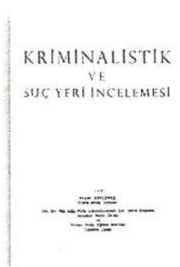
Kriminalistik ve Suç Yeri İncelemesi Ahmet SÖYLEMEZ, Haşmet Matbaası, İstanbul, 1982