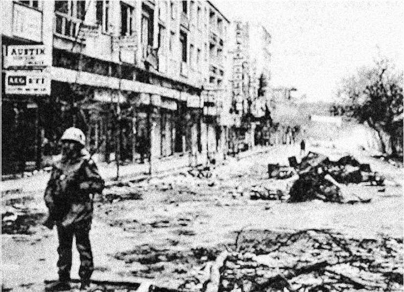
Maraş'ta katliam sonrası bir savaş görüntüsü vardır.

Soykırım , belli bir etnik veya dinî grubun bireylerine yönelik, bir plan dahilinde sistematik yok etme girişimidir. Maraş ve Çorum'daki şiddetin boyutları düşünüldüğünde, her ne kadar bir plan dahilinde olduğu anlaşılrsa da sis-