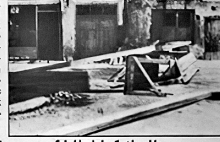
Sokaklarda barikat kuruldu.

Çorum'da dün yeniden alevlenen olaylar sırasında mahalle aralarına barikatlar kuruldu. Çiftliğe gid- diren çatışmaların meclis kararnamesine dönü- şerek yeni bir Kahramanmaraş katliamının patlak vermesinden korkulmaktadır.