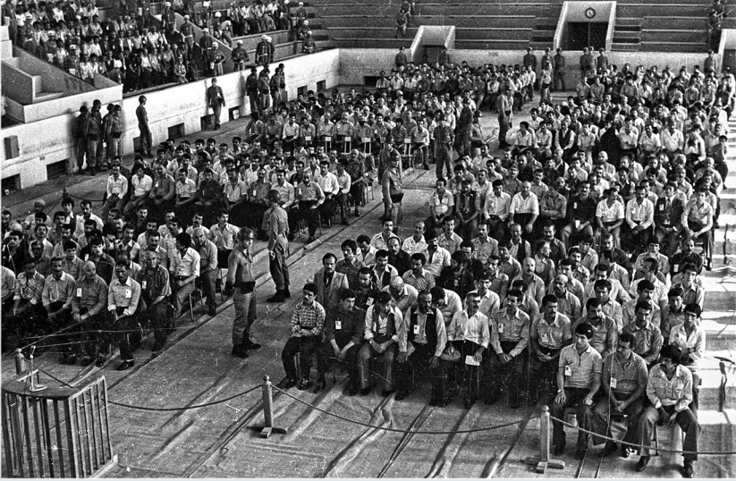
Maraş '78 yargılamasından.

tematik bir yok etmeden söz edilemez. Dolayısıyla soykırım tabiri, fazlasıyla iddialıdır.