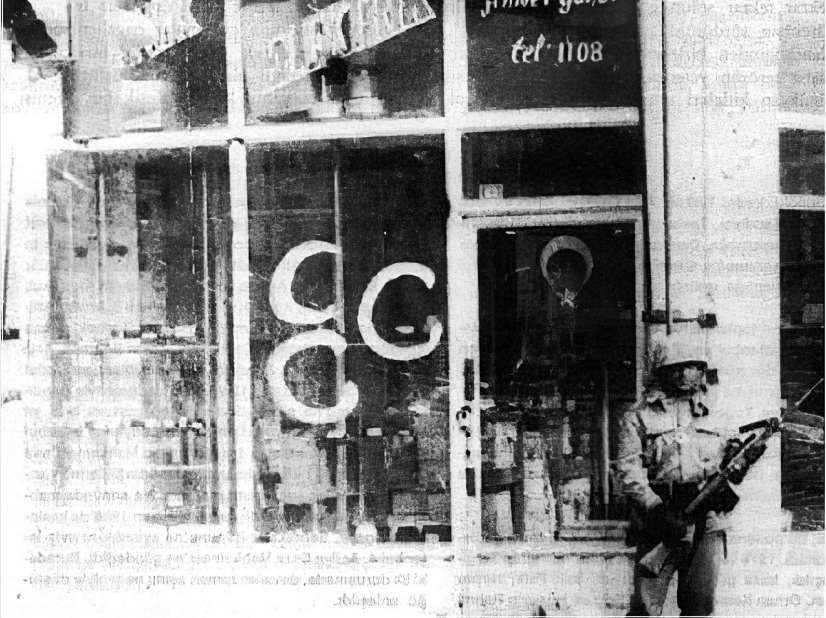
“Çarpi işaretli ev ve dükkanlara saldırı, bayraklı ve CCC işaretlilere dokunma!”

dıkları yerlerde insanları kurşunlar. Birçoğu ailesinin gözleri önünde katledilir. Birçok kadına tecavüz edilir. Yüzlerce insan yaralanır. Alevi ve solculara ait olduğu bilinen yüzlerce ev ve işyeri yakılır, tahrip edilir ve yağmalanır.