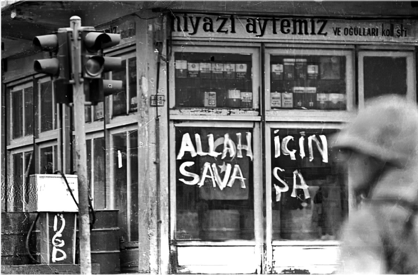
Maraş’ta dinî duygular ajite edilerek halk kitleleri harekete geçirilir ve “Allah için savaşa” davet edilir.

Birer gevşek çıkarlar konfederasyonu olan (her iki) MC Hükümeti’nin toplumdaki kutuplaşmayı önemsemeyerek CHP’yi ve demokratik kitle örgütlerini terörle özdeşleştirmesi, yaratılan bu düşmanlığın boyutlarını giderek artıracaktır. Yetmişlerin sonunda ülkücü-devrimci karşıtlığını aşan ve işi bir mezhep çatışmasına götüren altyapı, inanç üzerinden kurgulanır. Sağcı yerel ba-